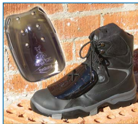
Artikelnummer #METGUARD Riemen Artikelnummer #METSTRAP

Geeignet für alle Arbeitsumgebungen und Industrien, einschließlich Bergbau, Bau, Fertigung, Transport, Forstwirtschaft, Einzelhandel, Lagerwesen