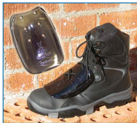
Artikelnummer #METGUARD Riemen Artikelnummer #METSTRAP

Geeignet für alle Arbeitsumgebungen und Industrien, einschließlich Bergbau, Bau, Fertigung, Transport, Forstwirtschaft, Einzelhandel, Lagerwesen