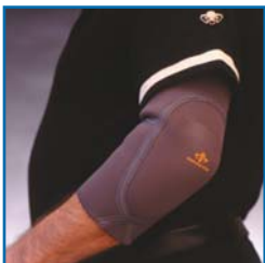
TS212 Ellbogen Gepolstert