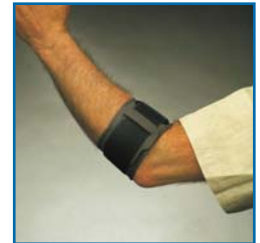
TS205 Tennis-Ellbogen Gepolstert