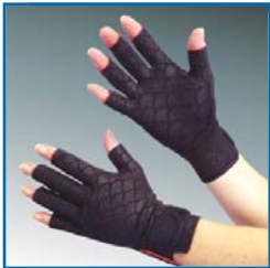
TS199 Thermo Handschuh