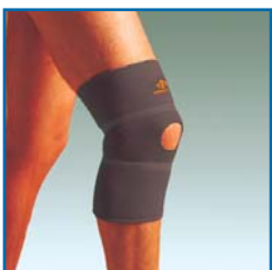
TS209 Knie-Bandage mit Patella Aussparung