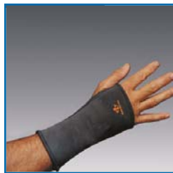
TS214 (L), TS215 (R) Handgelenk- Bandagelang