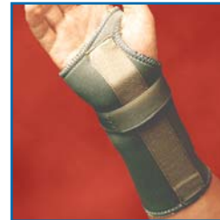
TS242 (L), TS243 (R) Karpaltunnel-Stütze