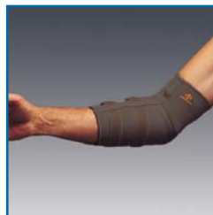
TS228 Ellbogen-Bandage mit Riemen