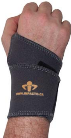
TS226 Beidseitig benutzbare Handgelenk-Bandage