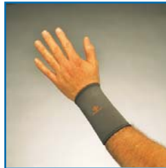
TS216 Handgelenk- Bandage