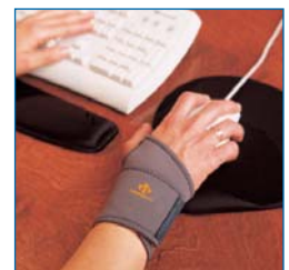
TS226-UREST Geeignet für Benutzer von PC-Tastaturen