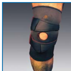
TS866 Knie-Bandage mit Patella-Stabilisator